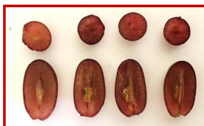
شکل ۲- وضعیت حبه‌ها از نظر تشکیل بذر در رقم امین. حداکثر یک بذر یا بقایای آن در هر حبه مشاهده می‌گردد