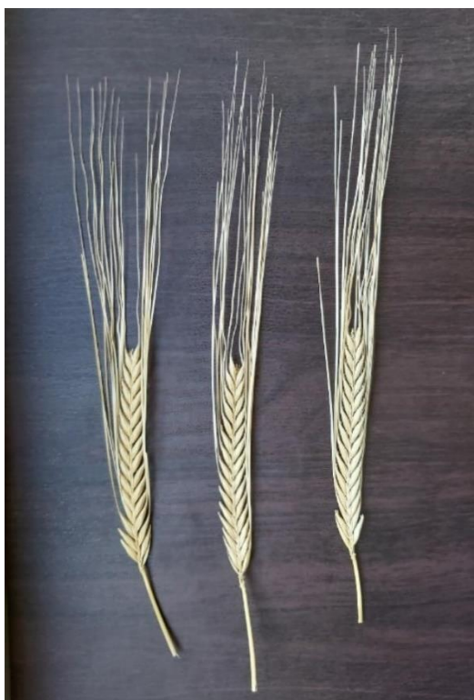
شکل ۲. سنبله‌های بدون گلچه‌های عقیم جانبی جو رقم نوبهار