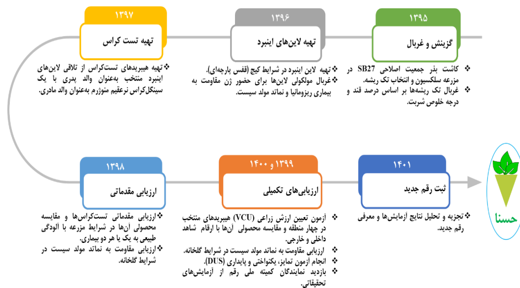
شکل ۱- روند اصلاحی رقم جدید حسنا با مقاومت دو گانه در برابر ریزومانیا و نماتد سیستی