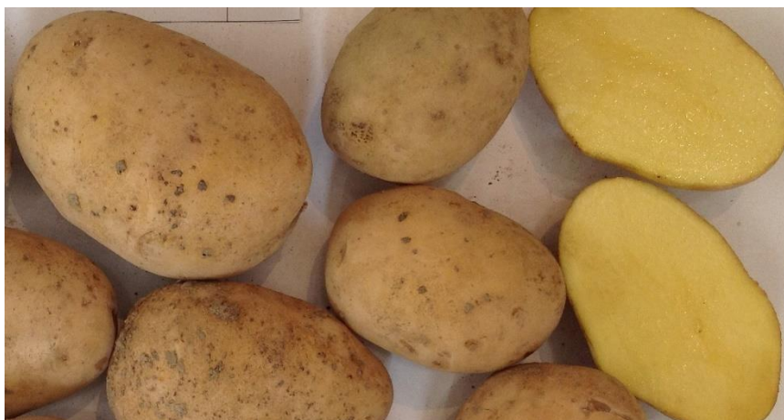
شکل ۲- تصویر فرم و رنگ گوشت غده رقم آتوسا

زمانی انجام می‌شود که ارتفاع بوته‌ها بین ۲۰-۱۰ سانتی‌متر بوده و خاک دارای رطوبت مناسب است. در زمان خاکدهی از عبور چرخ‌ها روی پشته‌ها خودداری شود. بهترین زمان برای برداشت رقم آتوسا وقتی است که گیاه به مرحله بلوغ فیزیولوژیکی که همزمان با زرد شدن برگ‌ها است، رسیده باشد. با این حال هر زمانی که عملکرد قابل قبولی تولید شده باشد و با توجه به هدف می‌توان ۱۵ تا ۲۰ روز قبل از برداشت اقدام به سرزنی و سپس برداشت نمود. استفاده از ادوات برداشت مناسب، کالیبره بودن دستگاه برای عمق و سرعت و رطوبت مناسب خاک به گونه‌ای که از بوجود آمدن کلوخه‌های تیز در زمان برداشت جلوگیری شود از جمله عواملی هستند که باید مورد توجه قرار گیرند تا از صدمات مکانیکی به غده جلوگیری شود. به منظور التیام غده‌های صدمه دیده ناشی از برداشت و حمل و نقل، لازم است غده‌های برداشتی به مدت دو هفته در دمای ۲۰-۱۵