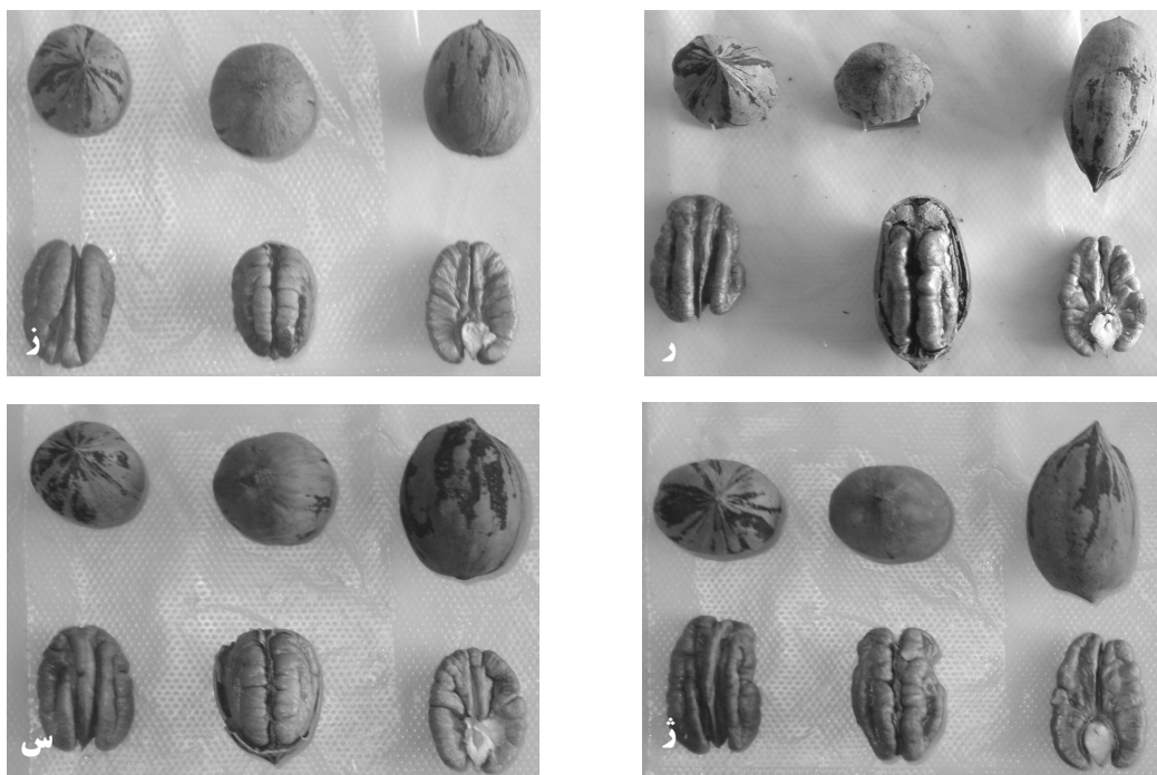
ادامه شکل ۱- ر) سه جی (3J)، ز) آپاچی (Apache)، ژ) ویچیتا (Wichita)، س) ۱۰ جی (10J)

درخت داشته است، برنامه‌های گسترش کشت آن در نقاط مختلف جهان از جمله هندوستان، اسپانیا، ترکیه و ایتالیا، طی سال‌های گذشته صورت گرفته و با جدیت ادامه دارد (۲، ۳ و ۲۰). با توجه به این ویژگی‌ها، برخی مناطق جنوب کشور به ویژه شمال استان خوزستان، برخی مناطق استان فارس و بوشهر، بخش‌های جنوبی استان لرستان، منطقه جیرفت و کهنوج، قسمت‌هایی از استان هرمزگان و همچنین مناطقی از شمال کشور به ویژه استان گلستان را برای توسعه پکان مناسب بوده و می‌توان باغات تجاری از این محصول احداث کرد.